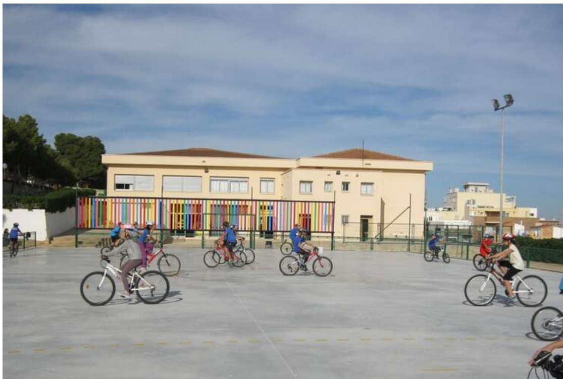
Escola Carles III a la Ràpita. | Generalitat de Catalunya