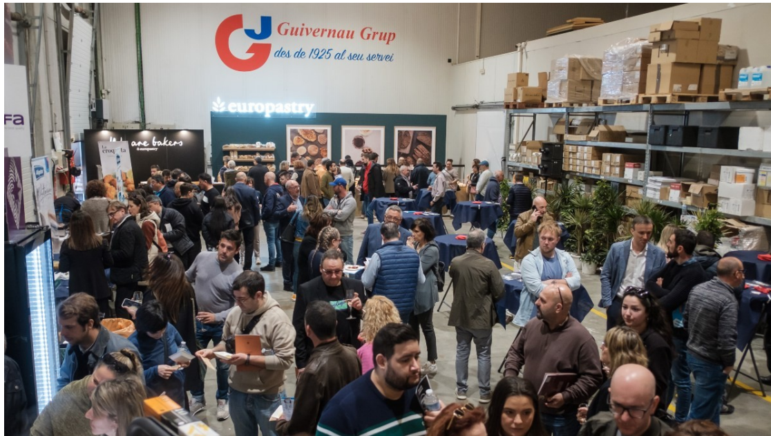
El Grup Guibernau ha recuperat la fira quatre anys després.